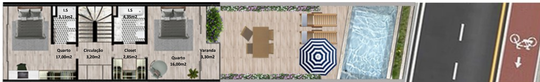
PLANTA 1º PISO

Os elementos constantes nesta planta são meramente indicativos, podem ser alterados e não têm carácter contratual. The information contained in this document is only indicative, may be changed and is not binding.