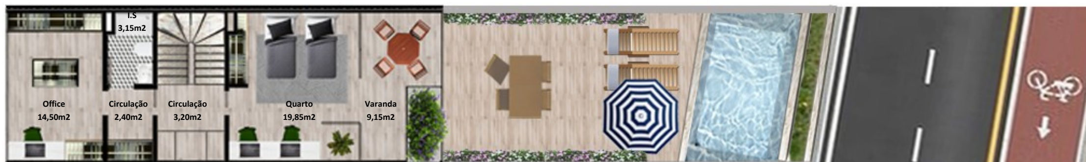
PLANTA PISO COBERTURA

Os elementos constantes nesta planta são meramente indicativos, podem ser alterados e não têm carácter contratual. The information contained in this document is only indicative, may be changed and is not binding.