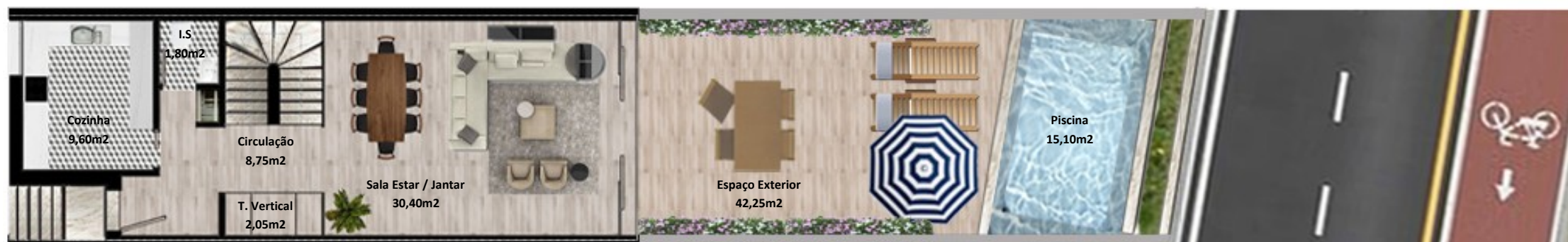
PLANTA PISO TERREO

Os elementos constantes nesta planta são meramente indicativos, podem ser alterados e não têm carácter contratual. The information contained in this document is only indicative, may be changed and is not binding.