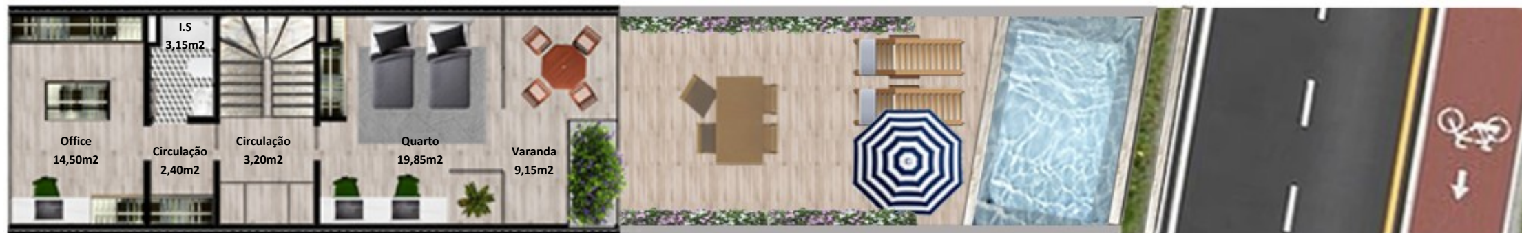
PLANTA PISO COBERTURA

Os elementos constantes nesta planta são meramente indicativos, podem ser alterados e não têm carácter contratual. The information contained in this document is only indicative, may be changed and is not binding.