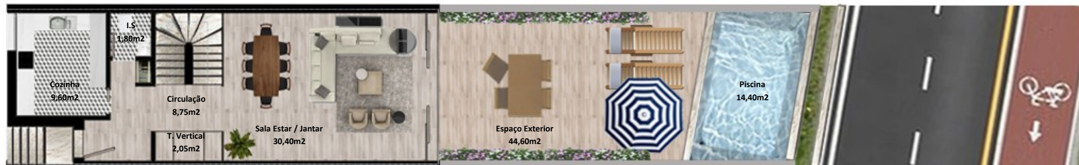
PLANTA PISO TERREO

Os elementos constantes nesta planta são meramente indicativos, podem ser alterados e não têm carácter contratual. The information contained in this document is only indicative, may be changed and is not binding.