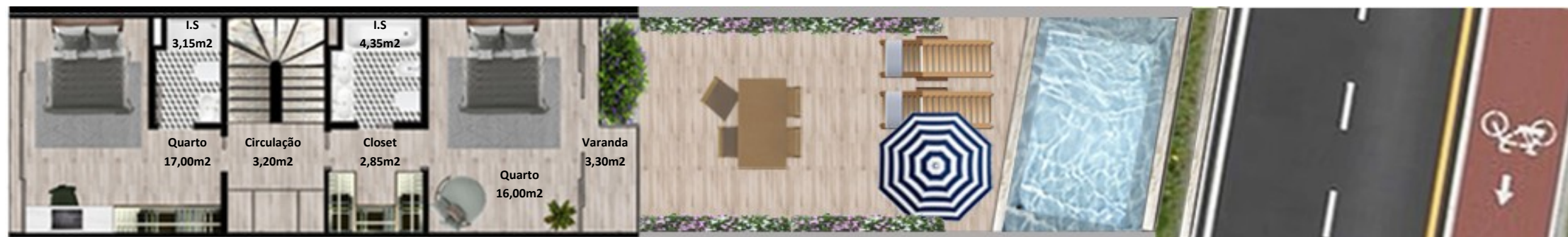
PLANTA 1º PISO

Os elementos constantes nesta planta são meramente indicativos, podem ser alterados e não têm carácter contratual. The information contained in this document is only indicative, may be changed and is not binding.