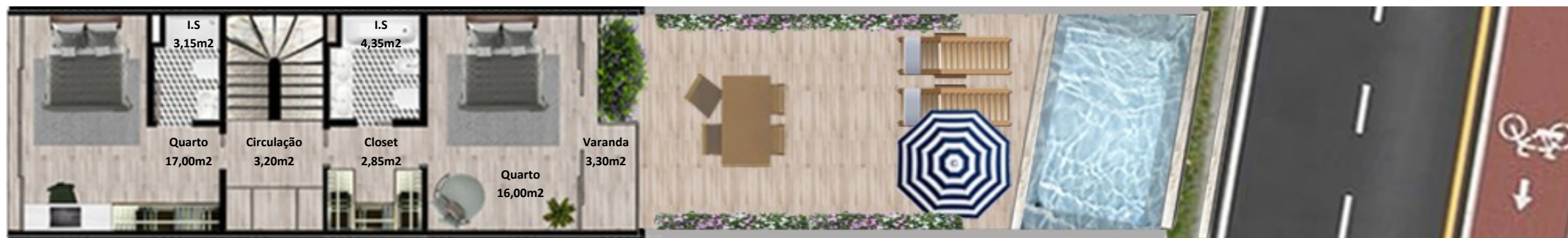
PLANTA 1º PISO

Os elementos constantes nesta planta são meramente indicativos, podem ser alterados e não têm carácter contratual. The information contained in this document is only indicative, may be changed and is not binding.