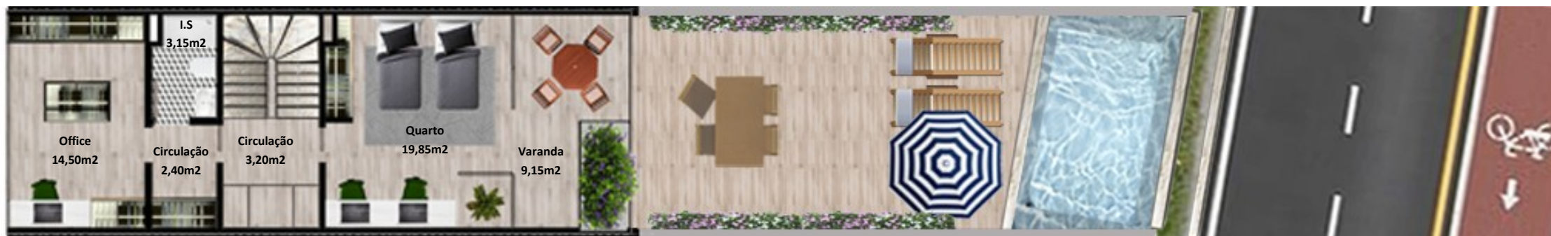
PLANTA PISO COBERTURA

Os elementos constantes nesta planta são meramente indicativos, podem ser alterados e não têm carácter contratual. The information contained in this document is only indicative, may be changed and is not binding.