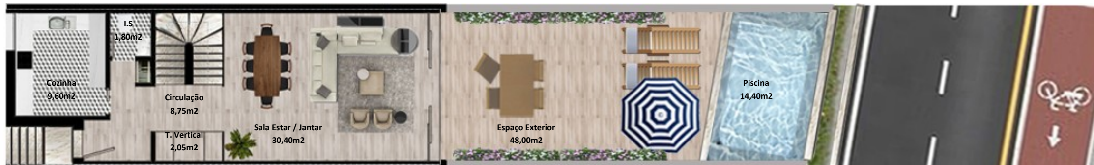
PLANTA PISO TERREO

Os elementos constantes nesta planta são meramente indicativos, podem ser alterados e não têm carácter contratual. The information contained in this document is only indicative, may be changed and is not binding.