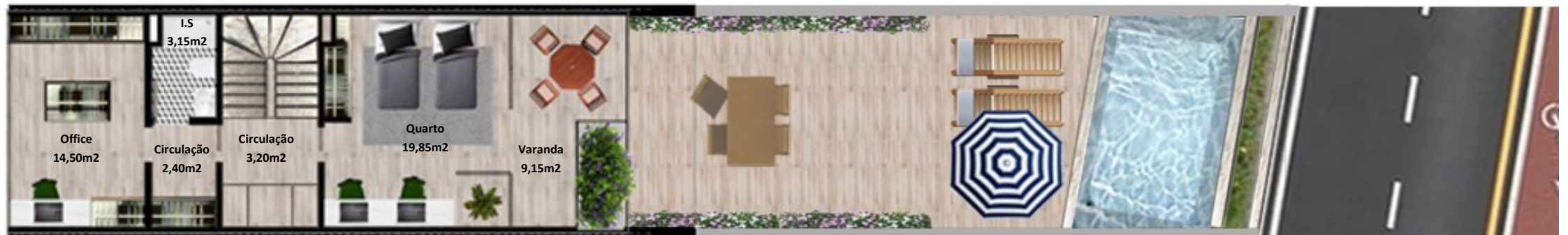
PLANTA PISO COBERTURA

Os elementos constantes nesta planta são meramente indicativos, podem ser alterados e não têm carácter contratual. The information contained in this document is only indicative, may be changed and is not binding.