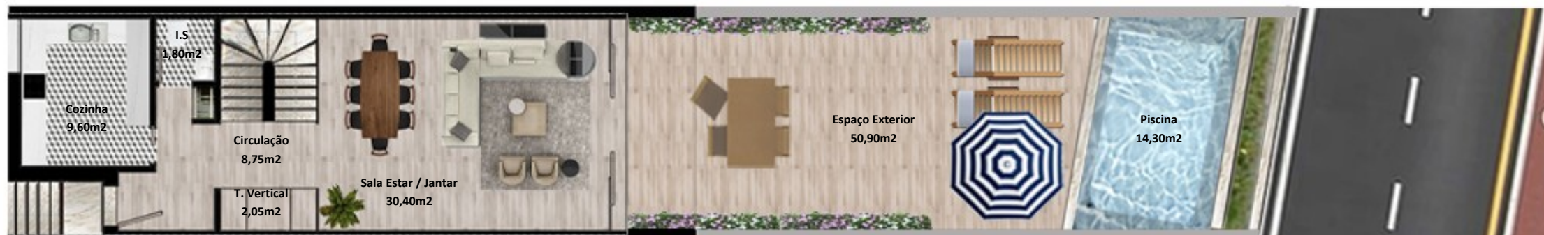
PLANTA PISO TERREO

Os elementos constantes nesta planta são meramente indicativos, podem ser alterados e não têm carácter contratual. The information contained in this document is only indicative, may be changed and is not binding.