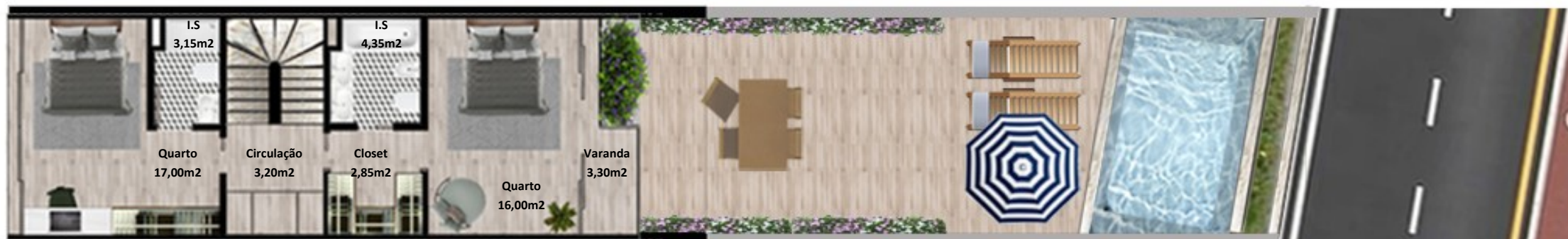
PLANTA 1º PISO

Os elementos constantes nesta planta são meramente indicativos, podem ser alterados e não têm carácter contratual. The information contained in this document is only indicative, may be changed and is not binding.