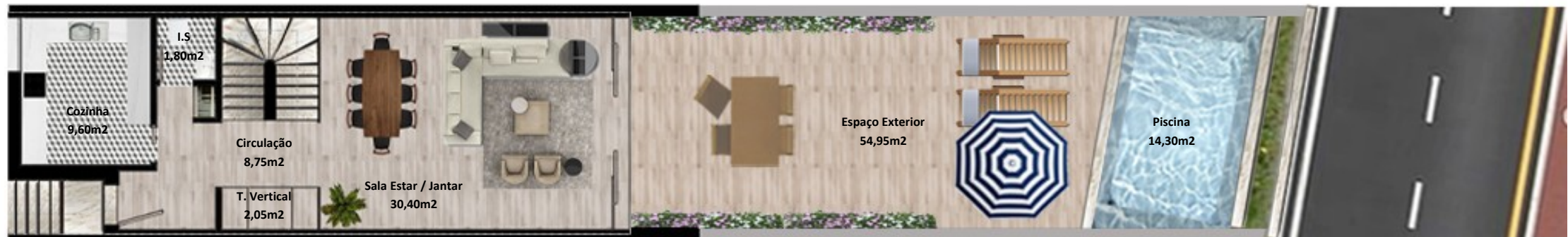
PLANTA PISO TERREO

Os elementos constantes nesta planta são meramente indicativos, podem ser alterados e não têm carácter contratual. The information contained in this document is only indicative, may be changed and is not binding.