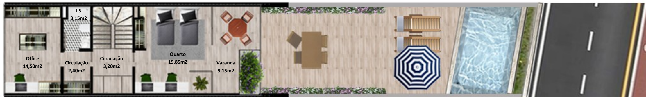
PLANTA PISO COBERTURA