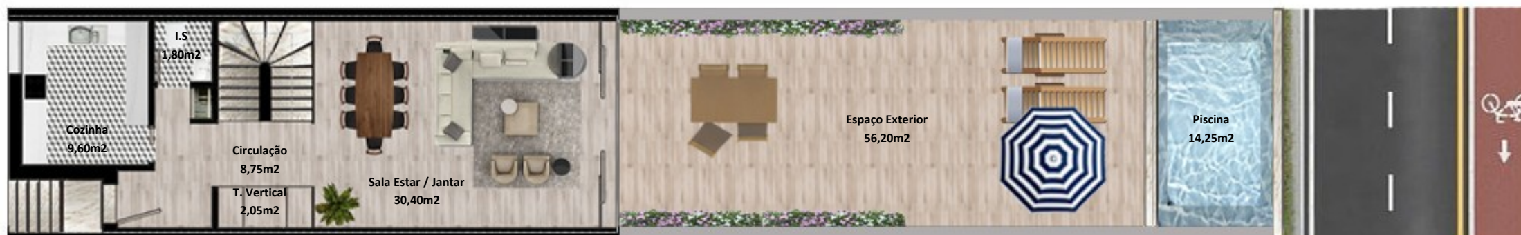
PLANTA PISO TERREO

Os elementos constantes nesta planta são meramente indicativos, podem ser alterados e não têm carácter contratual. The information contained in this document is only indicative, may be changed and is not binding.