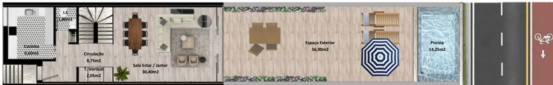
PLANTA PISO TERREO

Os elementos constantes nesta planta são meramente indicativos, podem ser alterados e não têm carácter contratual. The information contained in this document is only indicative, may be changed and is not binding.