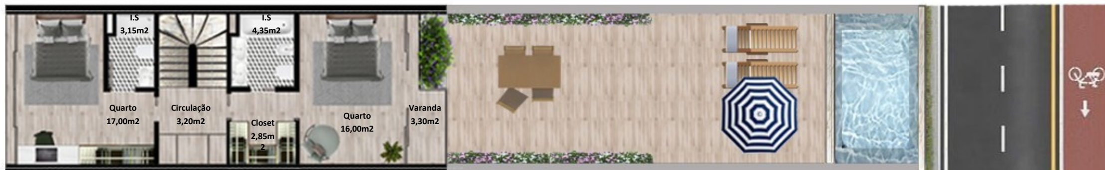
PLANTA 1º PISO

Os elementos constantes nesta planta são meramente indicativos, podem ser alterados e não têm carácter contratual. The information contained in this document is only indicative, may be changed and is not binding.