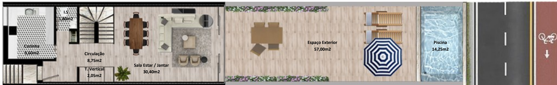
PLANTA PISO TERREO

Os elementos constantes nesta planta são meramente indicativos, podem ser alterados e não têm carácter contratual. The information contained in this document is only indicative, may be changed and is not binding.