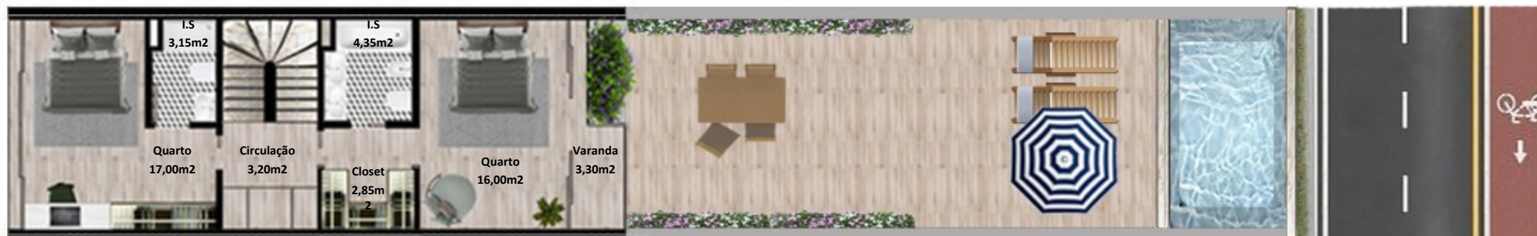
PLANTA 1º PISO

Os elementos constantes nesta planta são meramente indicativos, podem ser alterados e não têm carácter contratual. The information contained in this document is only indicative, may be changed and is not binding.