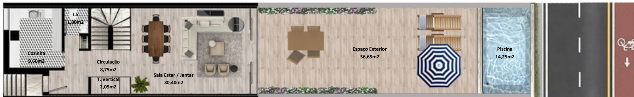
PLANTA PISO TERREO

Os elementos constantes nesta planta são meramente indicativos, podem ser alterados e não têm carácter contratual. The information contained in this document is only indicative, may be changed and is not binding.