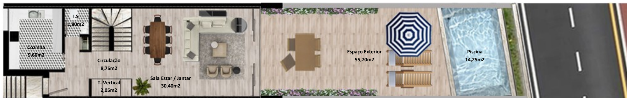
PLANTA PISO TERREO

Os elementos constantes nesta planta são meramente indicativos, podem ser alterados e não têm carácter contratual. The information contained in this document is only indicative, may be changed and is not binding.