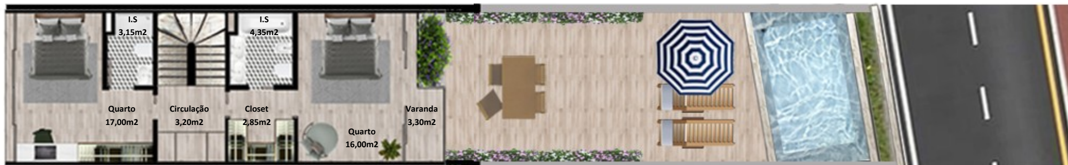
PLANTA 1º PISO

Os elementos constantes nesta planta são meramente indicativos, podem ser alterados e não têm carácter contratual. The information contained in this document is only indicative, may be changed and is not binding.