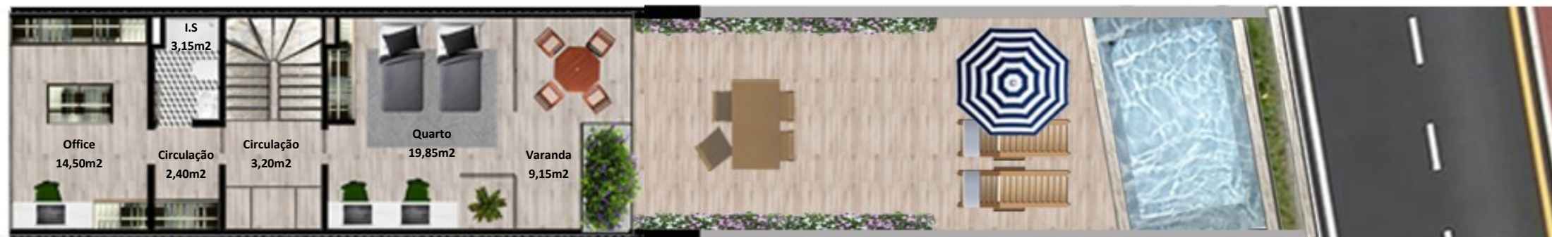
PLANTA PISO COBERTURA