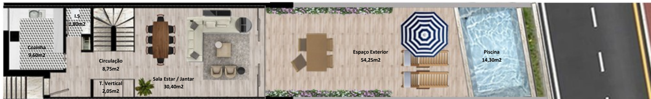
PLANTA PISO TERREO