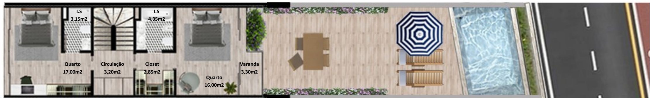
PLANTA 1º PISO