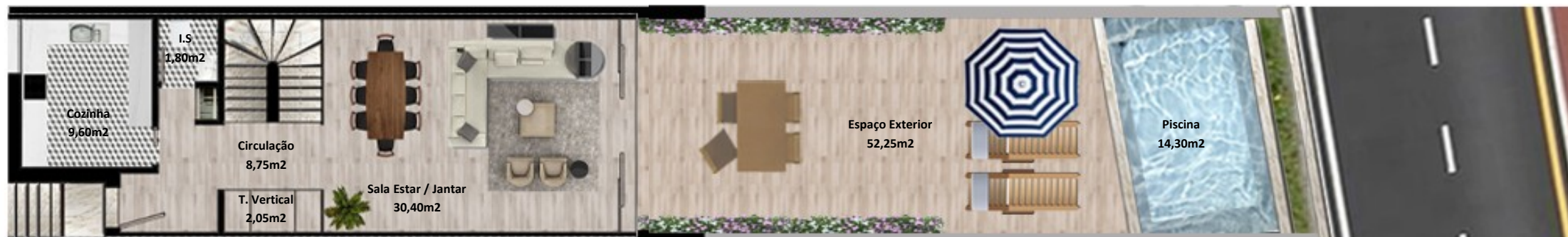
PLANTA PISO TERREO

Os elementos constantes nesta planta são meramente indicativos, podem ser alterados e não têm carácter contratual. The information contained in this document is only indicative, may be changed and is not binding.